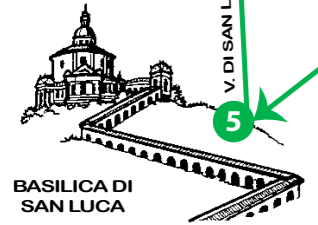
BASILICA DI SAN LUCA

Adulti / Adults euro 6,00 Bambini / Children 0-5 euro 3,00 Accompagnatore Disabile / Disabled person helper euro 3,00 Disabili ingresso gratuito / Disabled person free admission